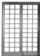
Porta de correr lateral romana 1,60 x 2,15 R$ 425,00