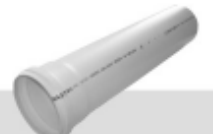
Tubo PVC 4" esgoto R$ 21,00