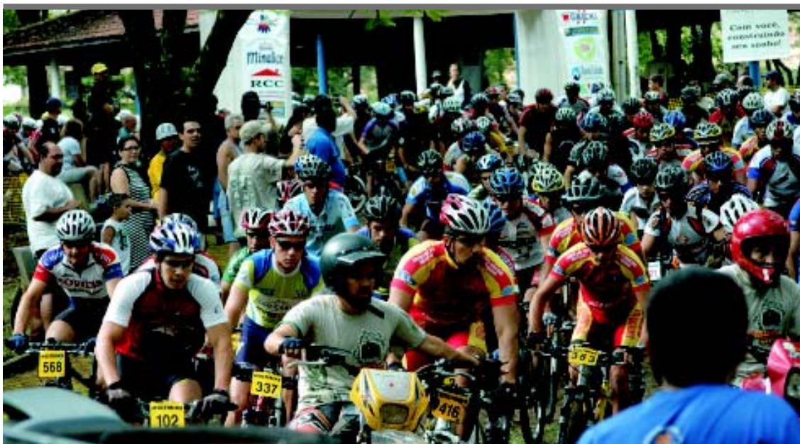
Final do Intermunicipal de Mountain Bike atraiu 150 competidores ao bosque