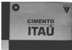
Saco de cimento (Itaú)