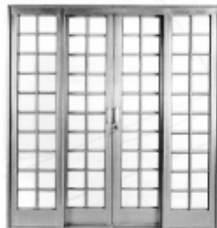
Porta de correr central Romana 2,00 x 2,15m R$ 577,00