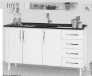
Gabinete de aço 1,50m R$ 239,00 2,00m R$ 294,00